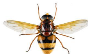
Moscas das flores, Volucella zonaria