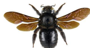
Abelha Carpinteira, Xylocopa violacea