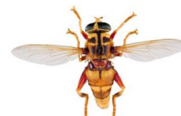
Moscas das flores, Milesia crabroniformis