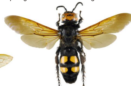
Vespa Mamute, Megascolia maculata